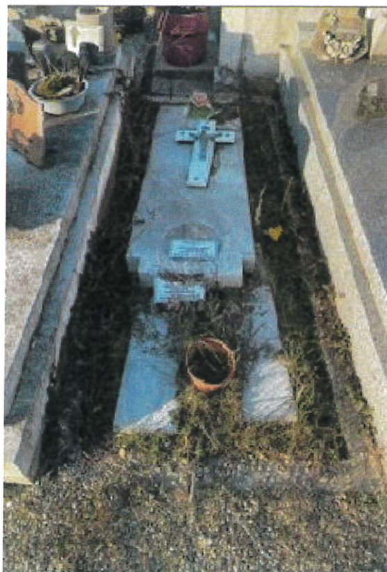
Photo 5 et 6 : tombe SAONIT constat réalisé le 07 janvier 2026 à 9h35