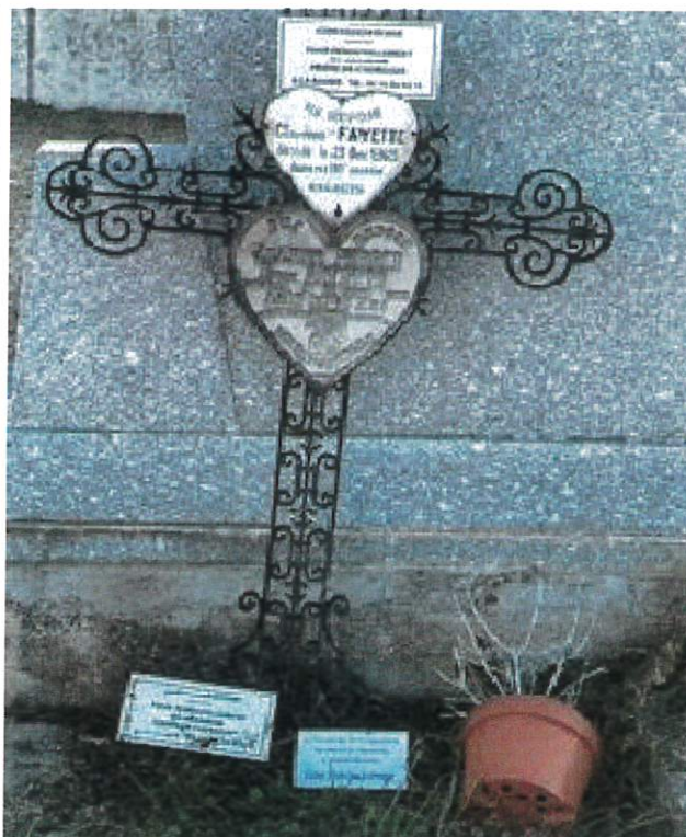
Photo 1 et 2 : vue de la tombe FAYETTE constat réalisé le 07 janvier 2026 à 9h35