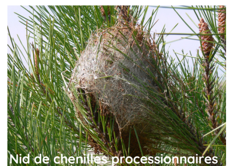
Nid de chenilles processionnaires

Vous pouvez contacter des professionnels qui auront l'équipement pour intervenir.