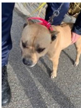
Photo de l'animal retrouvé attaché à un arbre avenue Berthelot à SAINT CLAIR DU RHONE le lundi 10 janvier à 11h30.

Dans le cadre d'une divagation de votre animal : Penser à mettre un collier sur lequel se trouvera votre nom votre adresse, vos coordonnées téléphoniques.