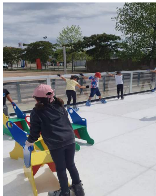
Patinoire synthétique lors du forum des associations

L'Accro Jeunes propose également un accompagnement scolaire pour les collégiens et lycées et une aide aux devoirs . Cette aide est gratuite ! Il suffit d'être inscrit à l'Accro ! Renseignements auprès de l'animateur Salem Bourras : 07 79 86 25 87.