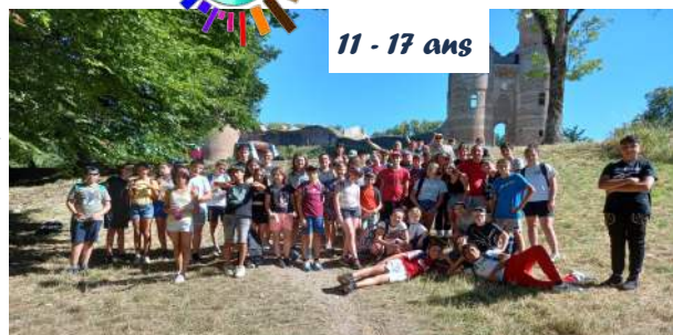
Rencontre inter-centres de loisirs Jeunesse

L'Accro Jeunes propose également un accompagnement scolaire pour les collégiens et lycées et une aide aux devoirs . Cette aide est gratuite ! Il suffit d'être inscrit à l'Accro ! Renseignements auprès de l'animateur Salem Bourras : 07 79 86 25 87.