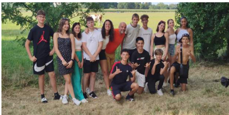
Une équipe d'animateurs sérieux et dynamiques !