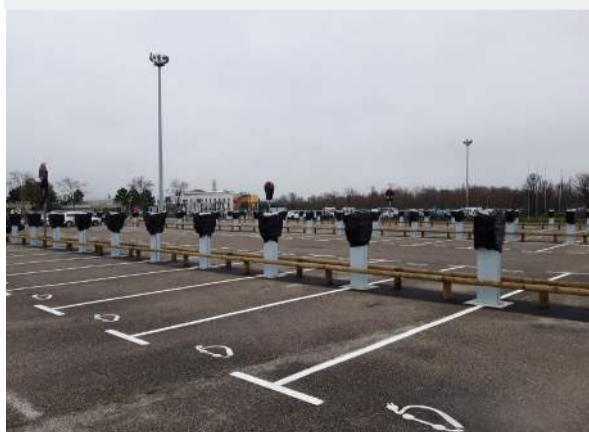
Les 148 bornes à charge rapide viennent compléter les huit autres mises en place précédemment, et seront opérationnelles à partir de mi-avril.

IZIVIA IG, filiale intra-groupe pour l'équipement du groupe EDF en bornes de recharge EV100*, vient d'installer 148 points de charge sur l'un des parkings de la centrale.