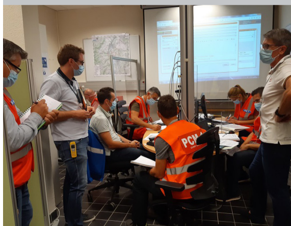
Lors des exercices, les acteurs se réunissent dans les postes de commandement, véritables centres névralgiques pour la prise de décision et la coordination des équipes sur le terrain.

La centrale organise régulièrement des exercices pour tester l'organisation qui serait mise en œuvre en cas d'événement inhabituel et pour maintenir les compétences des équipes.